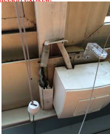
fils électriques dénudés